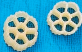
N° 265 17,4 mm