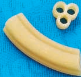
N° 258 12,5 mm