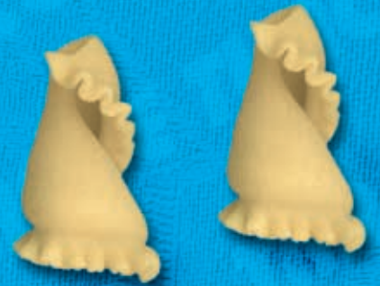
N° 252 11,4 mm