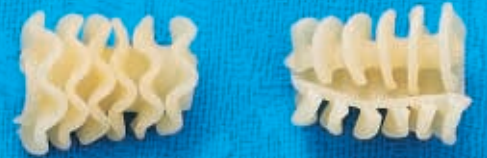
N° 261 25 mm