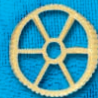
N° 271 25,4 mm