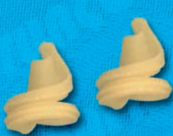
N° 250 10,4 mm