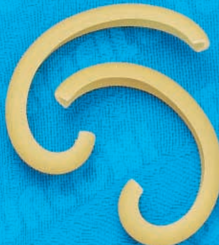
N° 268 6,6 mm