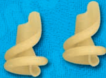
N° 251 10,4 mm