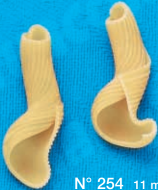
N° 254 11 mm