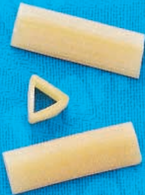
N° 264 11,4 mm