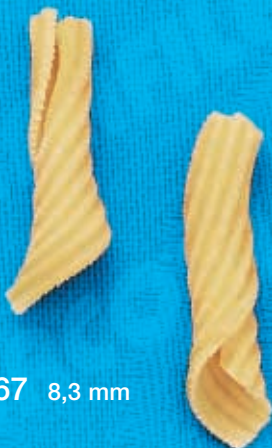
N° 267 8,3 mm