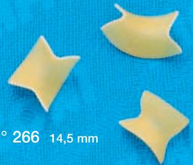
N° 266 14,5 mm